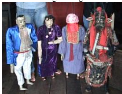
Gambar 2. Wujud Boneka Wayang Gantung Singkawang