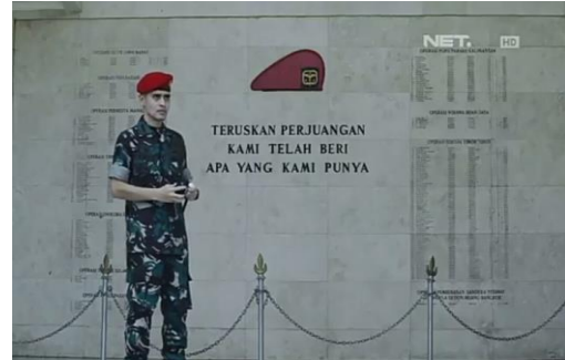
Gambar 2. Patriot episode 2, Kolonel Bayu dan tembok peringatan prajurit Kopassus yang telah gugur dalam tugas

simbol-simbol yang identik dengan Komando Pasukan Khusus (Kopassus).