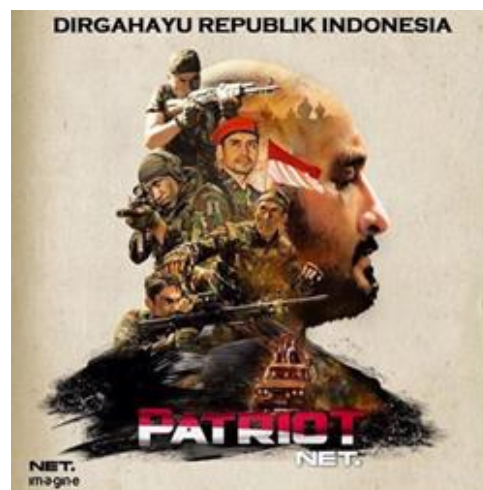
Gambar 1. Poster Patriot yang dirilis oleh akun resmi Patriot Net TV

blockbuster Hollywood tahun 90-an; satu pasukan terlatih dengan berbagai latar belakang, dibentuk, menyelamatkan suatu wilayah penduduk sipil yang diduduki musuh, menyelamatkan sandera, action adu tembak dan bela diri, musuh kalah, dan film selesai dengan akhir bahagia. Meskipun alurnya cenderung sederhana, boleh jadi conventional representational codes dan ideological codes -nya tidak sesederhana alur cerita yang ditampilkan. Dari seleksi dan pembacaan mendetail yang penulis lakukan, didapat beberapa representasi militer, khususnya Kopassus.