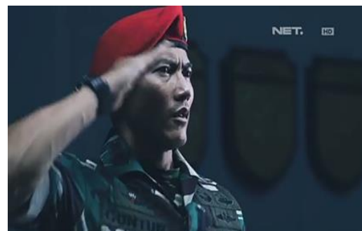
Gambar 3. Patriot episode 2, Letnan Kolonel Guntur bersiap menerima tugas

Secara visual, simbol Kopassus berupa baret merah selalu mendapat porsi yang tegas dan jelas dalam sudut pandang kamera. Sering kali baret merah ini diambil dengan sudut pandang close up . Salah satunya dalam scene di episode 2 ketika Letnan Kolonel Guntur ditugaskan untuk membentuk tim oleh Kolonel Bayu. Penegasan simbol baret merah juga kembali dimunculkan di episode 2 dalam scene persiapan persenjataan tim bunglon sebelum menjalankan misi. Hal ini secara tersirat menunjukkan peran sentral Kopassus dibandingkan kesatuan lain dalam serial Patriot .