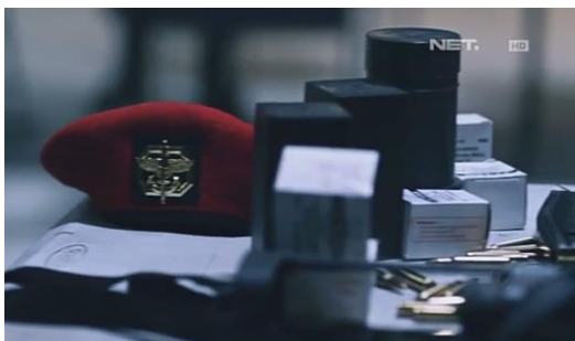
Gambar 4. Patriot episode 2, Close up baret merah di antara peluru dan senjata.