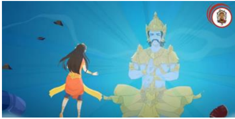
Gambar 6. Manik Mas Bertemu dengan Dewa Wisnu di Dasar Laut