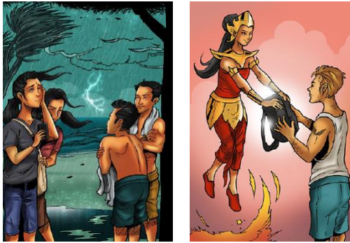
Gambar 1. Hubungan Harmonis antara Luh Ayu , Manik Mas , dan Beberapa Tokoh dalam Komik.

harmonis antar manusia. Hubungan harmonis tersebut berhasil diciptakan antara Luh Ayu dan turis laki-laki yang ditampilkan melalui ucapan terimakasih dan pemberian buku sebagai imbalan oleh turis. Bentuk keharmonisan antar manusia juga ditampilkan berulang kali oleh Luh Ayu dan Manik Mas kepada beberapa tokoh dalam komik pada edisi ketiga dan keempat. Keharmonisan tersebut tergambar melalui bantuan yang diberikan Luh Ayu kepada neneknya untuk membuat sesajen sebelum melakukan ritual banyu pinaruh di pantai.