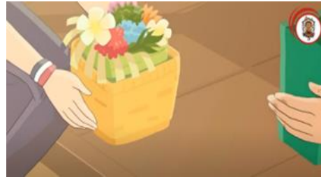
Gambar 3. Wujud Gelang Tri Datu

Pada edisi ketiga, kekuatan Manik Mas ditampilkan berupa deru air kuat yang berasal dari gelang tiga warna di tangannya yang berubah menjadi tongkat kecil. Gelang tiga warna digunakan Luh Ayu dan Manik Mas sebagai aksesoris di kedua pergelangannya. Gelang tersebut terbuat dari tiga benang berwarna merah, hitam, dan putih atau disebut dengan gelang Tri Datu . Seperti yang sudah dijelaskan pada pendahuluan bahwa Tri Datu diartikan sebagai susunan benang dengan nilai filosofis yang diyakini oleh umat Hindu memiliki kekuatan. Tri Datu memiliki arti benang ( datu ) berwarna tiga. Benang Tri Datu bukanlah sesuatu yang asing bagi masyarakat Hindu di Bali. Selain diperuntukkan sebagai pelengkap upacara-upacara tertentu, benang Tri Datu banyak digunakan sebagai identitas diri seseorang.