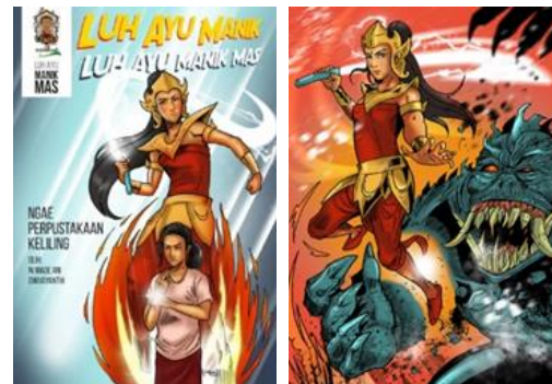
Gambar 7. Busana Superhero Manik Mas

Identitas pahlawan super biasanya terkandung dalam kostum ikonik, yang mampu mengekspresikan biografi, karakter, serta kekuatan yang dimilikinya. Melalui kostum yang digunakan, identitas superhero tersebut disembunyikan oleh tokoh superhero . Kostum yang digunakan Manik Mas dalam identitasnya sebagai superhero merupakan kostum yang memiliki unsur-unsur identitas Bali. Di bawah ini terdapat potongan beberapa gambar dari keempat edisi komik Luh Ayu Manik Mas .