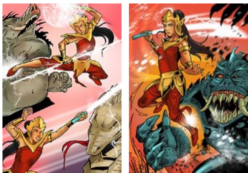
Gambar 5. Kekuatan Deru Air Superhero Manik Mas pada komik edisi ketiga.

Dalam proses transformasi Luh Ayu , ia memanfaatkan gelang Tri Datu ini sebagai media untuk bertransformasi. Sebuah tongkat kecil mulai terlihat ketika Luh Ayu melakukan transformasi menjadi Manik Mas dengan memanfaatkan gelang tiga warna di tangannya. Tongkat tersebut mampu mengeluarkan deru air kuat yang kemudian dimanfaatkan Manik Mas sebagai superhero perempuan Bali untuk melawan musuh. Musuh Manik Mas yang ditampilkan dalam komik ini merupakan monster berukuran besar dengan taring tajam, wajah menyeramkan, dan bersumber dari tempat-tempat yang banyak dijadikan tempat sampah dan barang-barang yang jarang digunakan lagi bagi manusia. Pada komik edisi kedua monster muncul dari rak buku, sedangkan pada edisi keempat monster muncul dari tengah laut. Di bawah ini terdapat beberapa panel yang menunjukkan Manik Mas sedang melawan musuh menggunakan kekuatan superheronya .