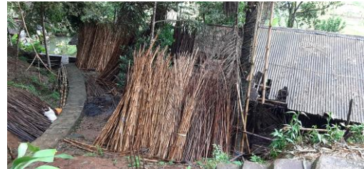
Gambar 3. Proses Pengeringan Bambu

Untuk menghasilkan bambu yang baik digunakan menjadi angklung, perlu diperhatikan beberapa ketentuan, seperti halnya menggunakan bambu yang sudah tua, dan memotongnya harus dilakukan pada pagi hari di musim baik yaitu musim kemarau atau sebelum memasuki musim penghujan.