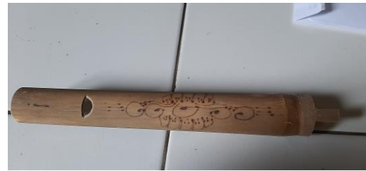
Gambar 4. Motif Rereng Barong

orisinal terdapat pula motif rereng barong modifikasi. Bagi seorang pengrajin, ciri khas penting untuk dimiliki. Meskipun pada dasarnya model angklung itu-itu saja, maka untuk membedakannya perlu ada sign product yang dapat meningkatkan nilai pada produk yang mereka jual. Di sisi lain keberadaan sign product juga untuk meminimalkan pemalsuan produk.