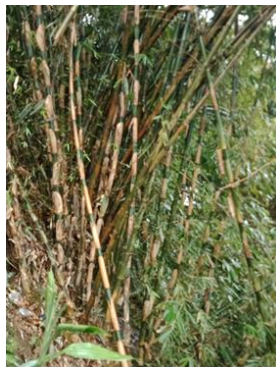
Gambar 2. Rumpun Bambu di Kampung Angklung

Kampung Angklung, sebelum mereka memproduksi angklung, sudah terlebih dahulu mereka melakukan pembudidayaan bambu dengan memanfaatkan lahan-lahan miring di daerah mereka guna ditanami rumpun-rumpun bambu. Sebagaimana disebutkan pepatah di atas bahwa gawir awikeun yang berarti memanfaatkan gawir (lembahan) untuk ditanami bambu, itulah yang dilakukan masyarakat Kampung Nempel.