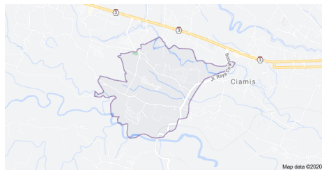
Gambar 1. Peta Desa Panyingkiran

Kampung Angklung Nempel secara administratif masuk ke wilayah Desa Panyingkiran, Kecamatan Ciamis, Kabupaten Ciamis. Desa Panyingkiran memiliki luas 229,81 Ha yang terbagi ke dalam 7 RW ini terletak sejauh 5 km dari ibu kota Kabupaten Ciamis. Berdasarkan Peraturan Daerah Kabupaten Ciamis NO/08/Pem.146.1/DS.SK/1984 tanggal 25 Februari 1984, ditetapkan mengenai batas-batas desa/wilayah yang juga tercantum dalam Perdes, yaitu: sebelah Utara (Sungai Cipalih, Desa Sindangrasa); sebelah Selatan (Sungai Citanduy Kab. Tasikmalaya); sebelah Timur (Desa Pawindan, Kec. Ciamis); dan sebelah Barat (Desa Imbangan, Kec. Ciamis).