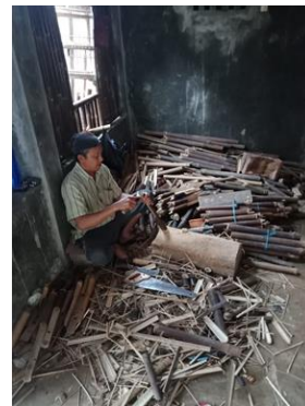
Gambar 7. Proses Nyoraan Angklung

Setelah tabung suara angklung dibentuk, untuk mengetesnya pengrajin mengukur nadanya dengan cara diketuk-ketuk atau dibantu dengan alat bantu pengukur suara yaitu tuner . Cara menggunakan tuner , harus memperhatikan dengan baik posisi lampu di sebelah kiri dan kanan panel tuner , dan juga jarum penunjuknya. Sebagai contoh jika membuat sebuah nada “F” maka angklung harus digoyangkan sambil memperhatikan lampu yang menyala bersamaan. Ketika nada yang tepat diperoleh, maka jarum penunjuk akan menunjukkan angka “F”. Bagi para pengrajin yang telah mahir, biasanya tidak menggunakan tuner melainkan hanya didasarkan pada perasaan atau feeling terhadap nada yang telah terlatih dengan baik.