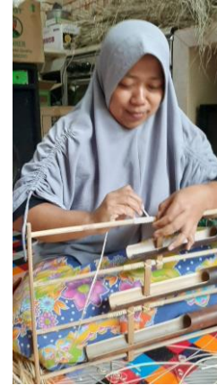
Gambar 8. Mengikat Angklung dengan Rotan

Tahap akhir dari proses pembuatan angklung adalah menguatkan rangkaian tabung dan rangkanya. Pada tahapan ini dilakukan proses pengikatan menggunakan tali rotan. Setelah itu baru dipernis agar lebih terlihat bagus sekaligus juga untuk lebih mengawetkan bahan. Proses ini umumnya dilakukan oleh kaum perempuan. Adapun alat yang mereka gunakan hanya berupa pisau raut untuk menghaluskan tali rotan dan tang untuk memotongnya.