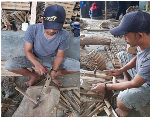
Gambar 7. Proses Melubangi dan Merangkai Angklung

Tabung suara angklung yang telah siap, kemudian dihaluskan menggunakan pisau raut dan amplas, lalu dilubangi di bagian atasnya menggunakan bor dan pisau. Di bagian lain tempat dudukan angklung juga dilakukan hal yang sama yaitu proses pelubangan. Jumlah lubang dudukan angklung disesuaikan dengan jumlah rangkaiannya tabung angklung dan galeger yang dibuat, bisa dua atau tiga lubang. Pada poses melubangi dudukan dan tabung angklung ini menggunakan berbagai alat seperti bor, pisau raut, dan gergaji. Setelah proses ini dilakukan barulah bagian-bagian angklung dapat dirangkai dengan cara ditempelkan keposisinya masing-masing.