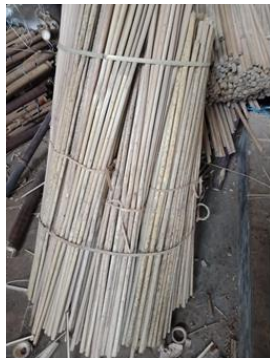
Gambar 6. Galeger

Bambu yang telah kering selanjutnya dipotong-potong khususnya bagian pucuknya yang disebut sebagai bakalan , sesuai dengan ukuran yang diinginkan. Bagian bambu lainnya dibentuk menjadi tiang-tiang angklung ( galeger ). Pembuatan galeger umumnya dikerjakan oleh pengrajin lain dari luar yaitu dari Desa Rajadesa, Ciamis. Adapun bagian bambu yang lebih besar digunakan untuk pembuatan tiang penyangga angklung set. Hal tersebut dilakukan bukan karena pengrajin di Desa Panyingkiran tidak dapat membuatnya sendiri, melainkan lebih pada membuka peluang usaha angklung semakin luas.